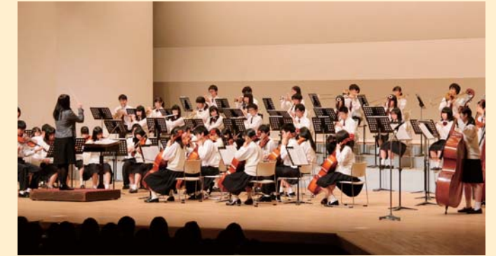
春日部共栄高等学校管弦楽「オーケストラの演奏」

今回、節目である第 10 回目の大会を開催するにあたり、私学振興大会のありかたや今後について、大会関係者一同、再度慎重審議し準備にあたってまいりました。振興大会と時を同じくして、設立から 10 周年を迎えた埼玉私学保連におきましても、その活動意義を改めて確認したうえで、埼玉県内の私立学校の振興・発展のため、今後も微力ながら力を尽くしていくことを決意した次第です。加盟校の保護者のみなさまにおかれましては、本大会の開催についてより一層のご理解をいただきまして、更なるご支援ご協力のほどよろしくお願い申し上げます。