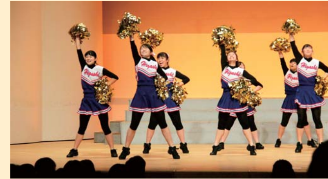
本庄東高等学校 「ダンス部」

発表を行ってくださった 2 校のみなさまには、この日のために練習や準備などにご尽力いただいたことに心より感謝申し上げます。今後、みなさまの益々のご活躍をお祈りしております。