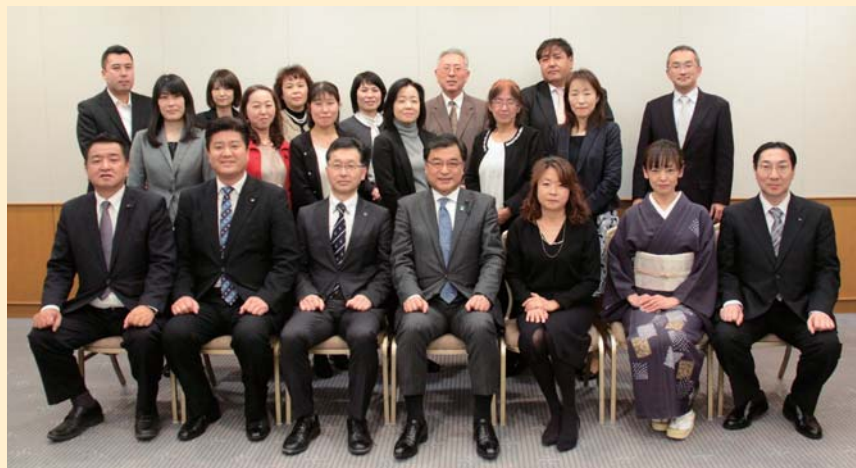
一年間、お世話になりました。