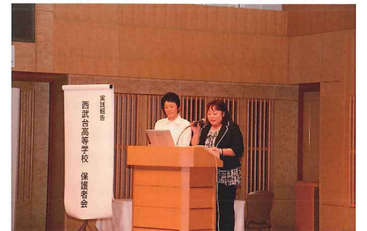
西武台高等学校保護者会の発表