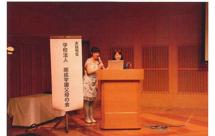
開成学園父母の会の発表