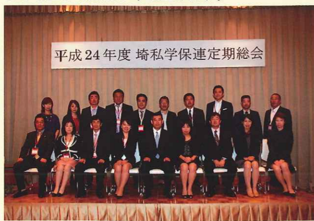
平成24年度 埼玉私学保連定期総会